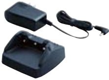
急速充電器 VAC-50A*2 小型で省スペース。専用ACアダプタ付属。