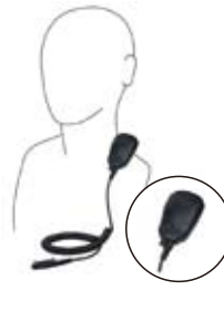
小型スピーカーマイク EK-404-581 握りやすい小型のスピーカーマイク。2.5Φのイヤホンジャック付。