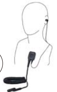
イヤホンマイク EM-200A7A 耳の中の振動を音声に変えるマイクイヤホン一体型。高騒音下でもクリアに通信。