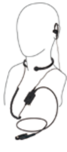
咽喉マイク & イヤホン EM-01-581 喉の振動を拾って音声に変えるマイク。周囲の騒音が激しい場所での使用に最適。