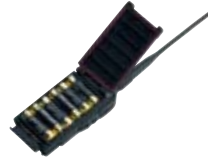
単3アルカリ乾電池ケース FBA-34*1 単3アルカリ乾電池6本で運用する場合の乾電池ケース。防水タイプ。