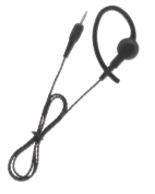
EA-581用イヤホン ME101/100CM 2.5Φプラグ、120Ω。ケーブル長100cm。