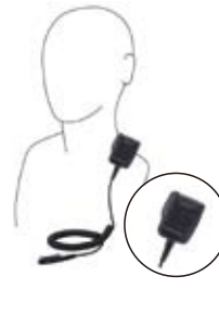
防水型スピーカーマイク MH-66A7A 無線機本体と同じ防浸構造のスピーカーマイク。3.5Φのイヤホンジャック付。