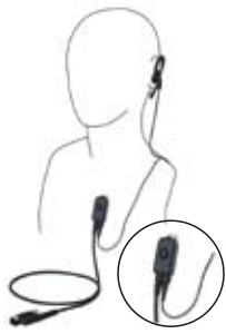
小型タイピンマイク & イヤホン EK-313-581 マイクは襟元にとめて通信。インナーイヤホンタイプ。