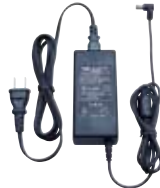
連結型充電器用ACアダプタ PA-47A 連結型充電器 (CD-51) に対応したACアダプタ。6台までの連結に対応。