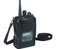
キャリングケース LCC-581 本体保護のために。肩掛けストラップ付。

*1 キャリングケース (LCC-581) は使用できません。本体ディスプレイのバッテリー残量表示はFBA-34には対応していません。 *2 充電電池は単体、無線機装着時、どちらでも充電できます。