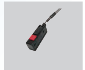
手元スイッチ (オプション)