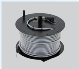
手巻きケーブルリール