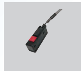
手元スイッチ (オプション)