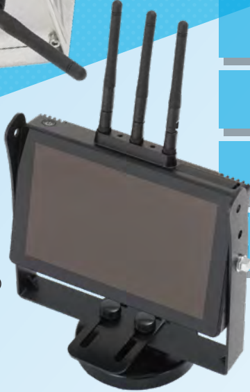
受信機一体型モニタ (WM44-SHD)