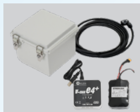
カメラ用バッテリー (バッテリーケース・ バッテリー本体・充電器)