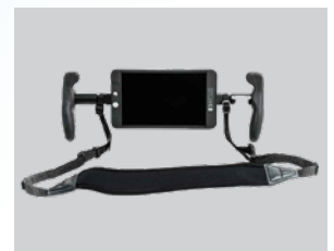
モニタハンドル+ ネックストラップ ※オプション品