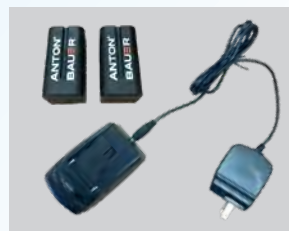
モニタ用バッテリー (バッテリー本体・充電器) ※オプション品